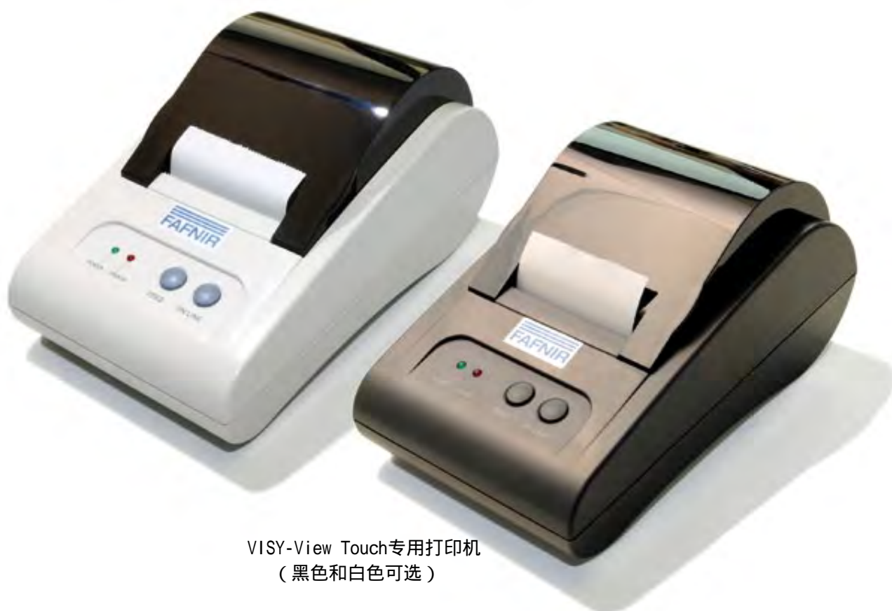
VISY-View Touch专用打印机 (黑色和白色可选)