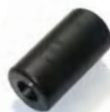
1" LPG 浮子